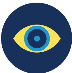
La piel y los ojos amarillentos