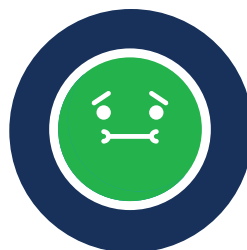
Náusea y/o vómitos