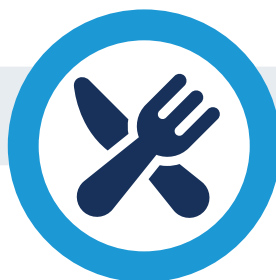
Comiendo/bebiendo alimentos contaminados