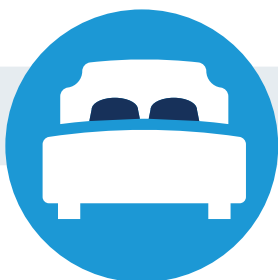
Teniendo relaciones sexuales con parejas infectadas