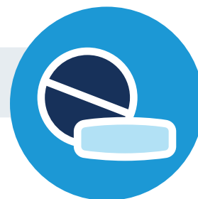
Uso de drogas recreativas

También puede transmitirse a través del contacto íntimo con una persona infectada con el virus de la hepatitis A.